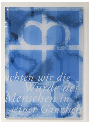
Die Werte aus dem Leitbild der Ambulanten Dienste wurden in der Gestaltung berücksichtigt.